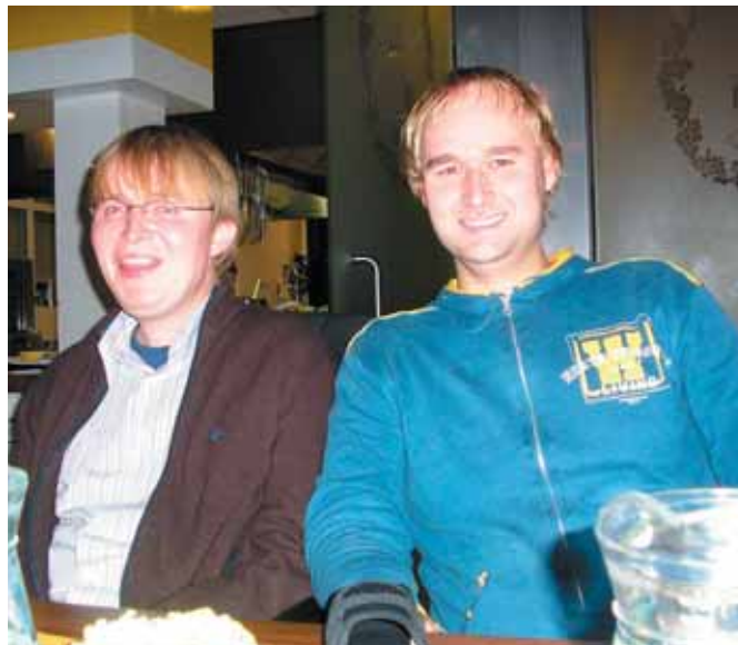
Belglane Brecht ja Argo

EMT andis teisipäeval, 10. jaanuaril 2007 Tallinna Heleni koolis üle jõuluaegse heategevuskampaania käigus kuulmispuudega laste toetuseks annetatud 245 884 krooni. Toetuse saajad Tallinna Heleni Kool, Tartu Hiie Kool ja Eesti Kuulmispuudega Laste Vanemate Liit tutvustasid toetussummade kasutamise plaane ning Eesti kuulmispuudega laste ja perede olukorda ja vajadusi. EMT heategevuskampaania «Jõulukalender 2006» raames koguti abivajajatele üle 1,3 miljoni krooni. EMT korraldab jõuluaegset heategevuskampaaniat juba neljandat aastat järjest ning kogutud toetuste kogusumma on 5,7 miljonit krooni.